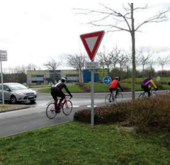
R415-10 : Refuser la priorité en entrant sur un giratoire = contravention de 4 e classe.

Le partage de la route ou de la rue dans le respect mutuel a ses propres règles. Ne pas les respecter, c'est aussi, au-delà de la sécurité de tous, s'exposer à des sanctions pécuniaires et parfois pénales.