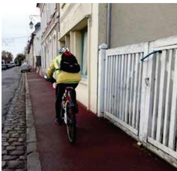
R412-7 : Circuler hors de la chaussée (sur trottoir) = contravention de 4 e classe.